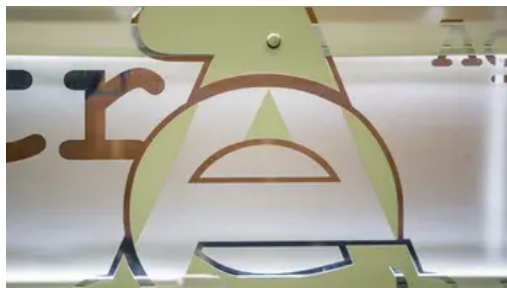
LA SEDE DELL'AGENZIA DELLE ENTRATE DI VIA CRISTOFORO COLOMBO IN ROMA

Avviso scadenza in arrivo: la sesta rata della rottamazione delle cartelle fiscali scade il 30 novembre , con la possibilità di pagare entro il 9 dicembre.